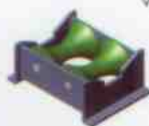
Rolete duplo côncavo