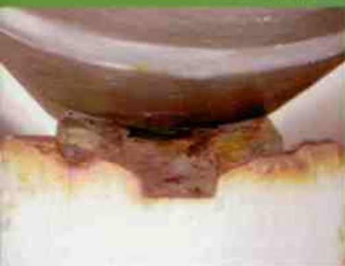
Roletes de aço com alto grau de corrosão