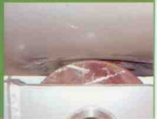
Petrobras - Roletes em Plástico de Alta Performance (RPAPI®) instalados nos pieres