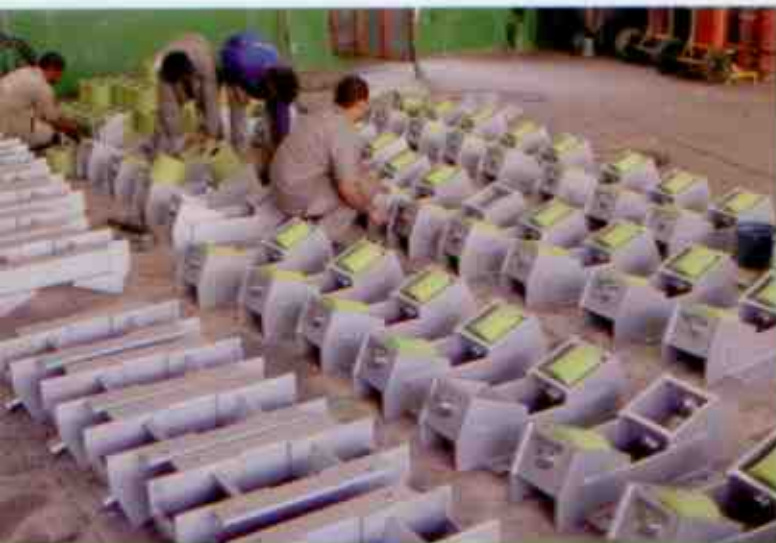
Suporte convencional a ser substituído