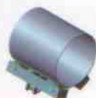
Vista de representação